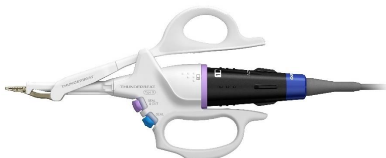
THUNDERBEAT Open Fine Jaw Type X