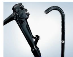
(右下) 大腸汎用ビデオスコープ OLYMPUS CF-XZ1200 シリーズ