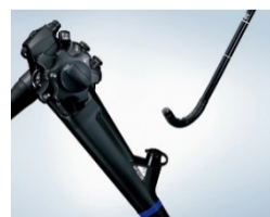
(左下) 上部消化管汎用ビデオスコープ OLYMPUS GIF-XZ1200