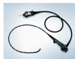
(右上) 上部消化管汎用ビデオスコープ OLYMPUS GIF-EZ1500