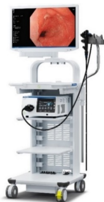
内視鏡システム「EVIS X1」 (システムセット例)

「EVIS X1」は、オリンパス独自の技術の搭載に加え、従来機である「EVIS LUCERA ELITE」と「EVIS EXERA III」の、それぞれ異なるスコープラインアップとの互換性も確保しています。これにより幅広いラインアップのスコープをお使いいただけ、内視鏡による診断・治療の可能性拡大に貢献します。