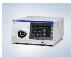
(左上) EVIS X1 ビデオシステムセンター OLYMPUS CV-1500