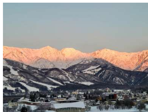
（左） Hakuba Zekkei Sauna “rooftop” （中） ロゴ （右） 白馬ハイランドホテル屋上からの景色