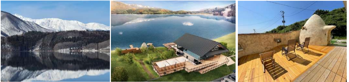
(左) 青木湖 (中) a0 LAKESIDE CAFE イメージ (右) アースバッグサウナのイメージ

「Hakuba Zekkei Sauna “a0”」の最大の特徴は、青木湖に直接飛び込めること。青木湖は流入河川もなく、北アルプスの山々から染み出す透明で冷たい湧き水だけで満たされているため、夏でも水温が低く安定しており、サウナで火照った身体を冷たい湖水でクールダウンでき、北アルプスからの涼風で外気浴を行うことで「ととのう」時間を楽しんでいただけます。