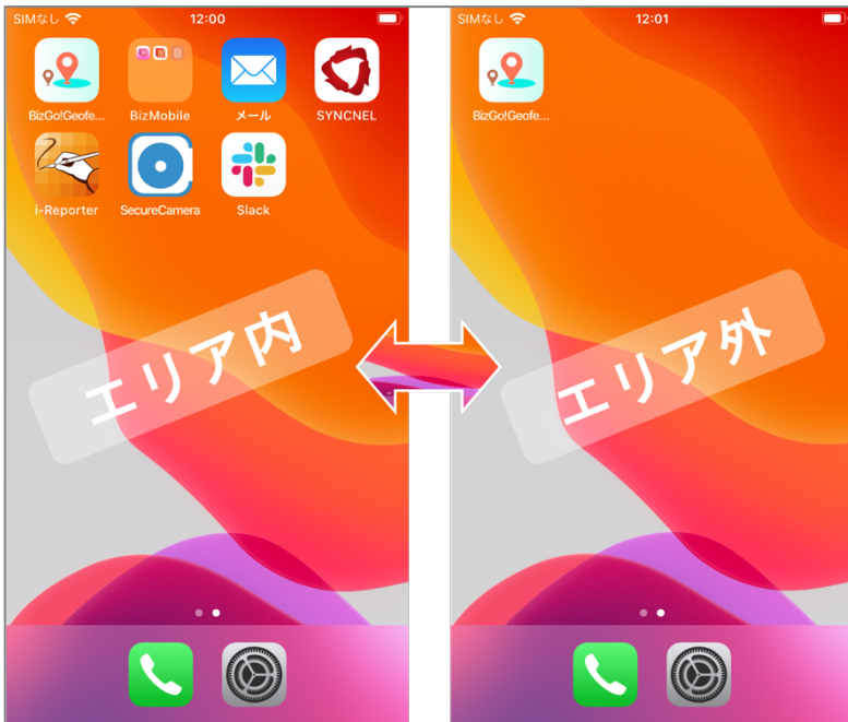
【図1：指定エリア内とエリア外での画面のイメージ】

ワークエリア外および勤務時間外には、スマートフォンやタブレット、PCの画面上のアプリのアイコンが表示されなくなるので、企業のシステムにアクセスする事ができなくなるため、情報漏洩やサービス残業の防止に繋がります。