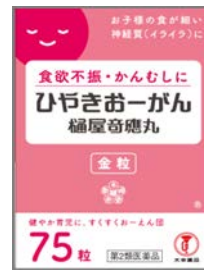
ひやしきおーがん 金粒 3～7歳未満 食欲不振 かんむしに