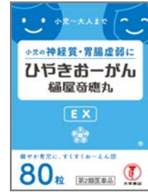
ひやしきおーがん EX 7～14歳未満 小児の神経質 胃腸虚弱・親のイライラにも