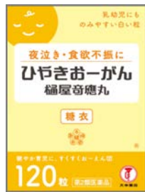
ひやしきおーがん 糖衣 0～3歳未満 夜泣き 食欲不振