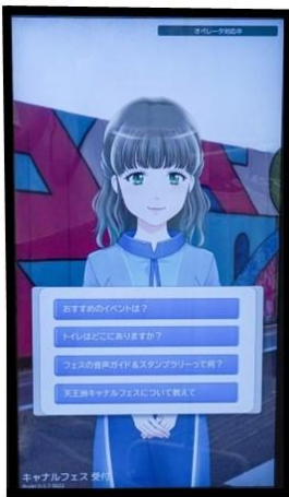
遠隔での受付対応

これまで、天王洲キャナルフェス開期中にも実証実験として無人観光案内所を設置し、効率的な会場案内や店舗、イベントブースへの送客による盛り上げと消費促進を図ってきました。今回の天王洲エリア内への無人観光案内所の設置により、人的リソースや人件費、インバウンドへの観光案内対応などへの課題を解決するものと期待しています。