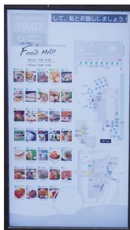
エリアマップ表示