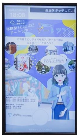
アートツアーの申込