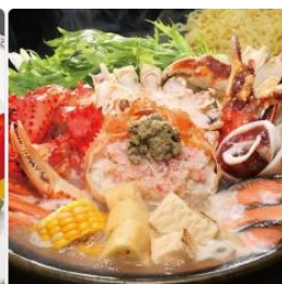
▶ 三六がにの鉄砲鍋セット