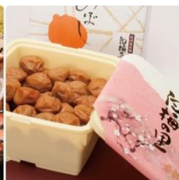
▶ 和歌山県特産紀州南高梅「白梅の里」