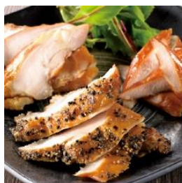
▶ 愛知県・鶏三和 三和の地鶏 名古屋コーチン焼しどり