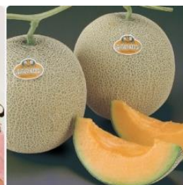
▶ 北海道 ふらのメロン