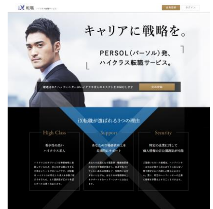
ハイクラス転職サービス サイトイメージ