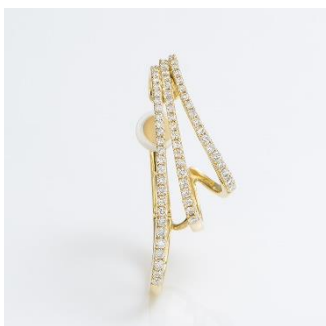
EE017CRD K18 ダイヤモンド イヤークフ 左耳用 total 0.40ct K18 税込み 451,000 円