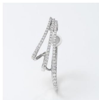
EE017CRR PT ダイヤモンド イヤークフ 右耳用 total 0.40ct PT 税込み 429,000 円