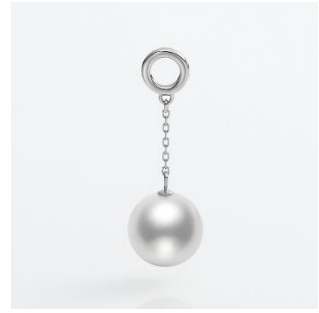
CM006-9W PT アコヤ チャーム パール 8.5mm up PT 税込み 110,000 円

* Hyacca のジュエリーは一つ一つ手作業で作られています。 そのため、カラット（重さ）は一点ごとに若干の違いが生じることがあります。