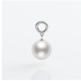
CM003-9W PT アコヤ チャーム パール 8.5mm up PT 税込み 110,000 円