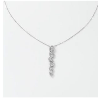
AI001NRC PT ダイヤモンド ペンダント total 1.00ct PT 税込み 814,000 円