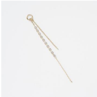
CM002RD K18 ダイヤモンド チャーム total 0.20ct K18 税込み 165,000 円

光沢が美しいパールと、軽やかなチェーンタイプのイヤークフチャーム。ピアスにも付けられるカスタマイズジュエリーとして人気のアイテムです。