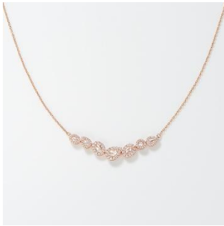
AI001NRC-2 K18PG ダイヤモンド ネックレス total 1.00ct K18PG 税込み 946,000 円

「Hyacca」では、傷や内包物が少なく透明感の高いローズカットだけを厳選し、メレダイヤモンドの繊細なラインが、ペアシェイプやオーバルなどのユニークなファンシーカットを、甘くなり過ぎないモダンな印象へ仕上げます。