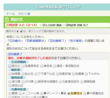
<WEB 問診画面イメージ>

外来にはタブレット端末を活用した問診システムを、健診には WEB 事前回答を導入。忙しい方でも来院しやすいよう、スマホ診察券を利用した自動受付や WEB 予約システムも採用します。