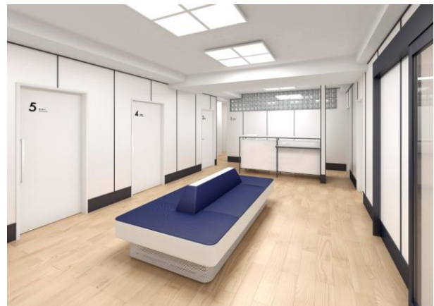
<クリニック内観イメージ>

チームメディカルクリニックでは、効率の良いオペレーションのため、外来にはタブレット端末による問診システムを、健診の問診にはWEBによる事前回答を取り入れました。WEB 予約や“スマホ診察券”による自動受付の仕組みも作り、スピーディーでストレスのない受診を実現いたします。