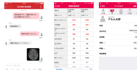
<Join 使用画面> <MySOS 使用画面>

健康診断結果を管理できるスマートフォンアプリ「MySOS」を外来・健診両方に導入することで、来院者は健康診断結果や服薬履歴をスマホで確認できます。また、アルムと東京慈恵会医科大学附属病院の共同研究により開発され、薬機法における医療機器プログラムとして認証された、医療関係者間コミュニケーションアプリ「Join」も活用。慈恵医大と連携することで、オフィス街のクリニックでありながら大学病院の専門医による高度な診断を受けることができます。