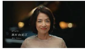
ピアニスト、 西村由紀江