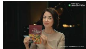
万田酵素は 自然の素材を 発酵熟成させているから まさに自然の発酵食品