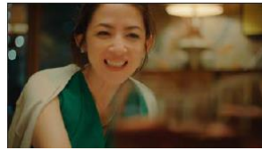
食べたいとおもったものを しっかり食べるように しています