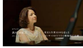
第一線で 活躍を続けている彼女が 常に心がけてきたことは