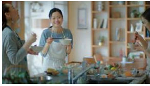
これからは 今までとは違う形で つきあっていかなないとあつ て