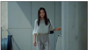
現役生活を終え 芸術監督として 新たな表現を探っていく