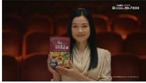
万田酵素は 自然の素材を しっかり発酵させているから 体が欲しがらる感じがします