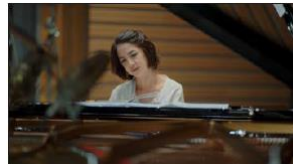
日々自分に素直に 過ごすようにしてます