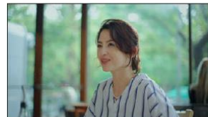
円熟味が ましたというか