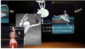
長年にわたり 英国ロイヤルバレエ団で プリンシパルとして活躍