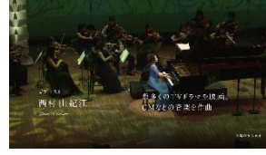
デビュー以来 数々の楽曲を残し