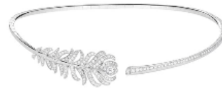
ブリュム ドゥ パオン ネックレス スモール