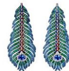
ブリュム ドゥ パオン ペンダントイヤリング ラージ

素材：タンザナイト(0.80ct)、ブラウンダイヤモンド(0.37ct)、ダイヤモンド(0.08ct)、ツァボライト(1.34カラット)、サファイア(1.70ct)、チタン、ホワイトゴールド