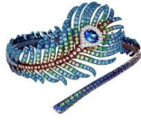
ブリュム ドゥ パオン プレスレット