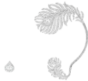
ブリュム ドゥ パオン アシンメトリー イヤリング