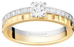
キャトル ラディアント ソリテール リング ¥ 819,500~