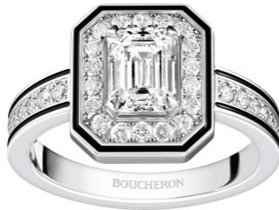
ヴァンドーム リズレ ソリテール リング ¥4,369,200(税込み・予定価格)

ブライダルフェア期間中には、2月に発売開始となった新作ジュエリーも揃います。メゾンが1893年から本店を構えているパリ・ヴァンドーム広場を俯瞰で見た八角形のフォルムから着想を得てデザインされたコレクション「ヴァンドーム リズレ」より、新作のソリテールリングとピアスが登場しました。既存のセンターストーンが0.3カラット、0.5カラットの作品のほか、新たにセンターストーンが1カラットのソリテールリングが加わりました。優美なダイヤモンドの輝きを引き立てるブラックラッカーがアクセントになり、身につける人の個性を際立てながら、モダンで洗練された印象を演出します。