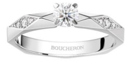
ファセット ソリテール リング ハーフパヴェ ¥ 643,500~

ブライダルフェア期間中には、2月に発売開始となった新作ジュエリーも揃います。メゾンが1893年から本店を構えているパリ・ヴァンドーム広場を俯瞰で見た八角形のフォルムから着想を得てデザインされたコレクション「ヴァンドーム リズレ」より、新作のソリテールリングとピアスが登場しました。既存のセンターストーンが0.3カラット、0.5カラットの作品のほか、新たにセンターストーンが1カラットのソリテールリングが加わりました。優美なダイヤモンドの輝きを引き立てるブラックラッカーがアクセントになり、身につける人の個性を際立てながら、モダンで洗練された印象を演出します。