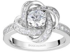
ビヴォウヌ ソリテール リング ¥ 814,000~