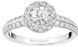
エトワール ドゥ パリ ソリテール リング ¥ 885,500~