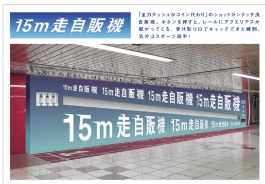
2018年度、第2回のプランニング部門 グランプリ作品「15m走自販機」