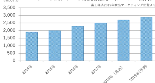
(百万円) ヨーグルト風デザート販売額推移 (メーカー出荷)

富士経済の調査(ヨーグルト風デザート市場)によると、2015 年以降販売額の伸長率が右肩上がりりで推移しています。2019 年は販売額 29 億円と予測されており、引き続き市場は続伸する見込みです。今後、さらなる市場活性化が期待されています。