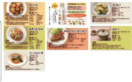
「みそまかせ」レシピブック