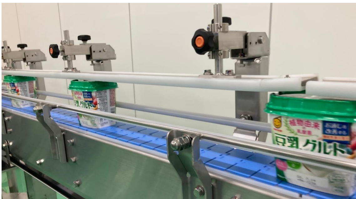
※インテージ SRI+ 植物性ヨーグルトカテゴリー 2018年11月~2021年10月累計販売金額