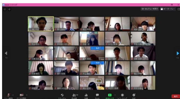
オンライン新入社員研修