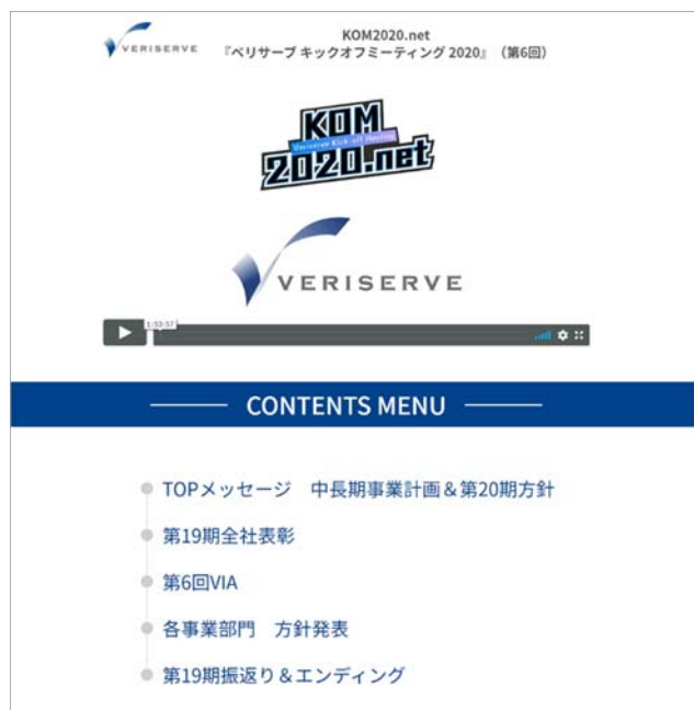
社員総会動画配信