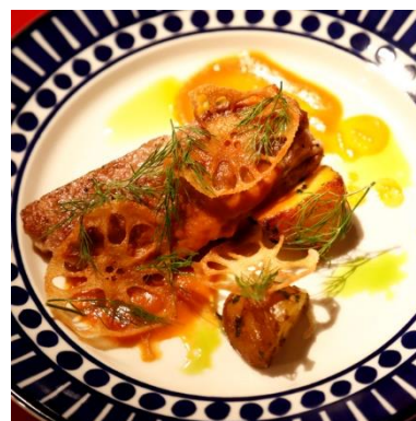
シェフ考案のスペイン産白豚肉 料理のひとつ

今回のキャンペーンローンチに伴い、2019年9月12日、報道関係者及び業界関係者を対象にしたランチョンセミ