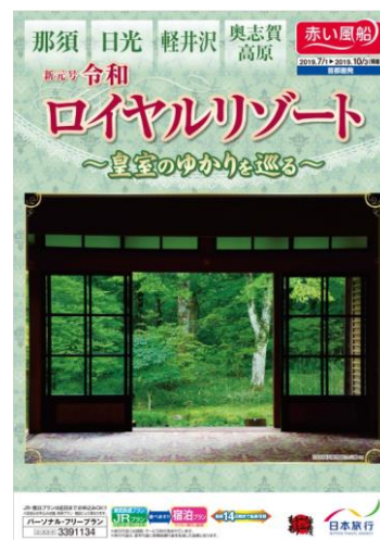
新元号令和 ロイヤルリゾート