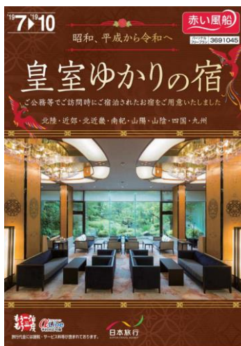
皇室ゆかりの宿（関西発/九州発）