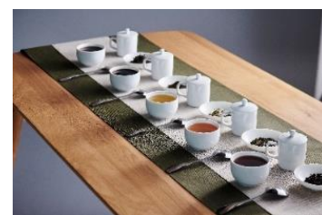
※画像はいずれもイメージ