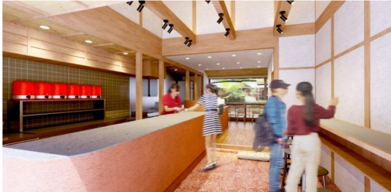
※「ゴンチャ 京都二寧坂店」内観イメージ

この度「ゴンチャ 京都二寧坂店」を構える二寧坂は、世界遺産、清水寺の参拝道としても知られます。八坂へと続く石畳の坂道、風情ある格子戸の家並みが連なる美しい景観で、文化庁の〈重要伝統的建造物群保存地区〉として指定される産寧坂へと至ります。日本有数の歴史的価値を有するこの地に、ゴンチャを出店させていただくことを幸甚に存じます。