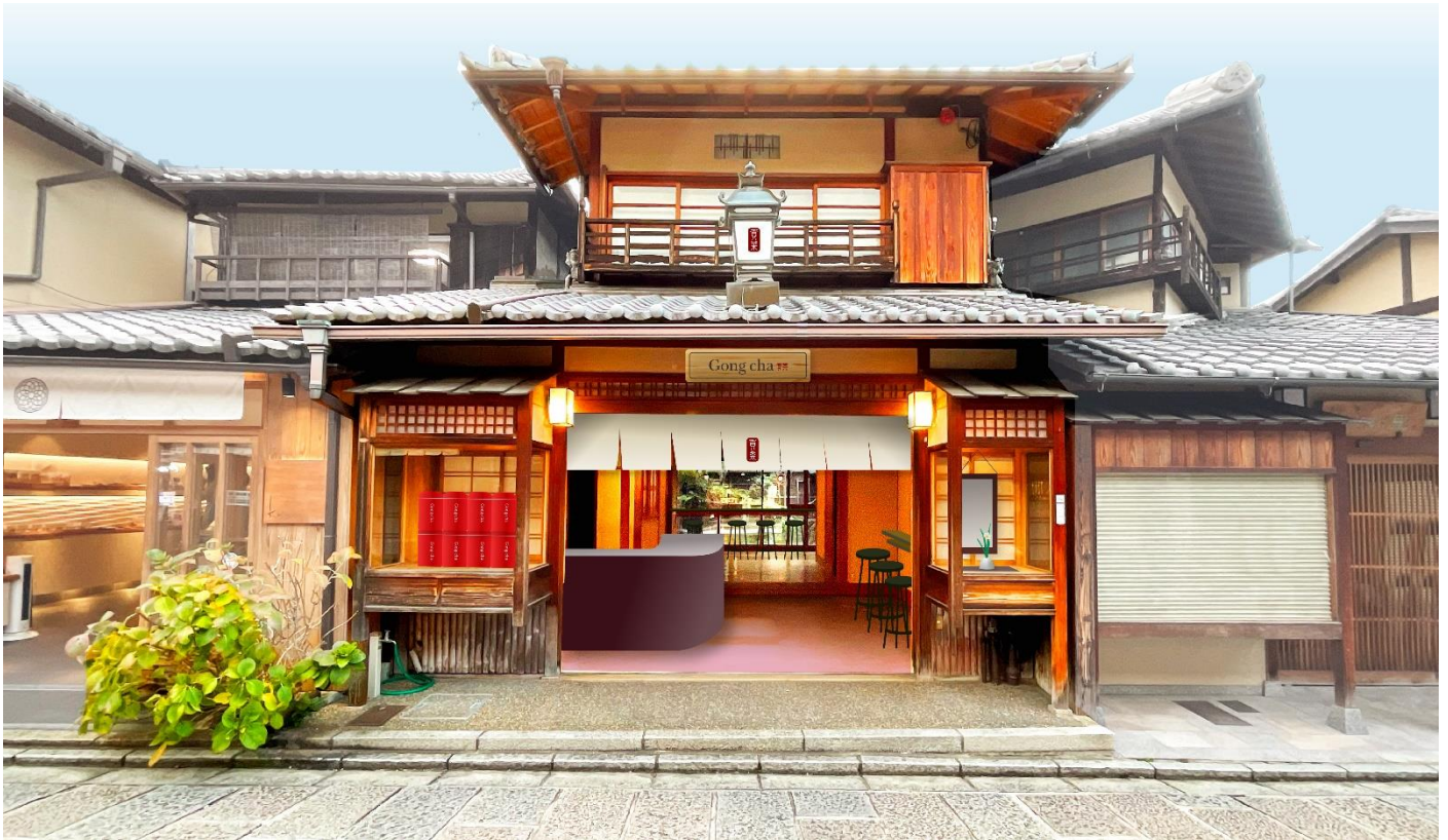
※「ゴンチャ京都二寧坂店」外観イメージ

日本家屋を活用した店舗はゴンチャ初。世界遺産、清水寺を望み、祇園社の総本社、八坂神社へと続く、日本の歴史と伝統が息づく地で、グローバルティーブランド、ゴンチャの新たなステージが始まります。