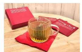
※使用イメージ (販売は左記商品のみ)

気分やお好みで選べる、「阿里山ウーロンティー」「烏龍ティー」「ブラックティー」の3種ティーバッグ詰め合わせは、ちょっとしたお礼や気の置けない方へのプレゼントにもおすすめです。