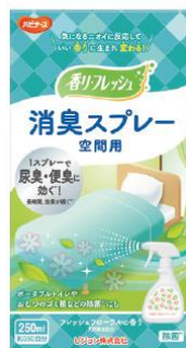
消臭スプレー 空間用