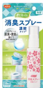
消臭スプレー 濃縮タイプ