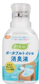
ポータブルトイレ用 消臭液