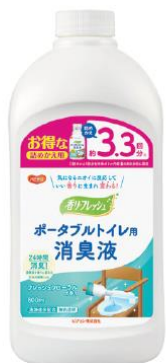
ポータブルトイレ用 消臭液 詰めかえ用