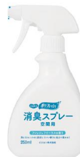
消臭スプレー 空間用 業務用