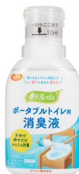
ポータブルトイレ用消臭液 300ml