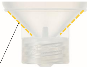
残存を低減させるために設置した傾斜部分

受け止めた初乳を余すことなくシリンジに入れるため、傾斜を付加。デバイス内の残存を低減し、一滴でも多くの初乳を赤ちゃんに届けます。