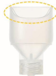
さく乳・採取時に視界を確保するくぼみ