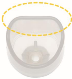
すくい取り接地面積を広くするための直線形状