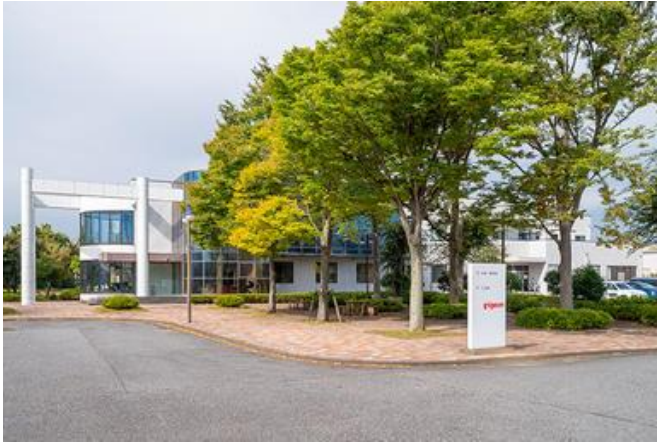
茨城県にある緑に囲まれた、ピジョン中央研究所

URL： https://www.pigeon.co.jp/about/companyinfo/pigeon-laboratory/