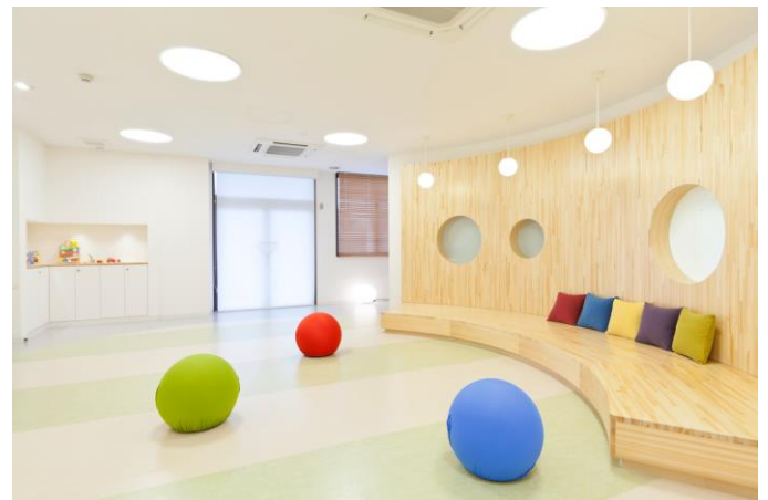
ピジョン中央研究所のモニタールーム