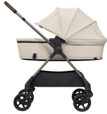
ベージュ (アカチャンホンポ限定カラー)