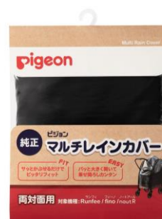
マルチレインカバー 両対面用