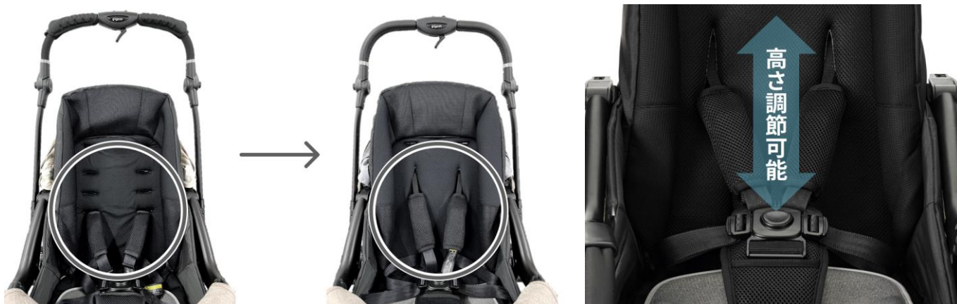
左：2022年モデル 右：2023年モデル