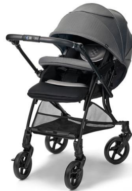
チャコールグレー