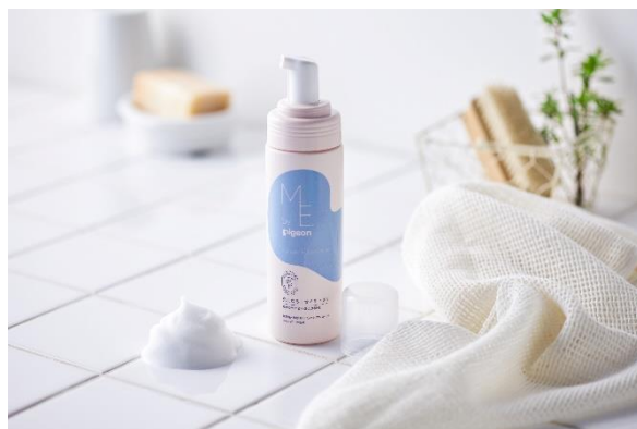
「ME. by Pigeon」サイト： https://shop.pigeon.co.jp/pages/mebypigeon.html

当社が、0～11ヵ月のお子様をお持ちのママを対象に2022年3月に実施した調査※2では、出産時に会陰切開・裂傷を経験したママは70%にのぼりました。さらに、産後の会陰の悩みに関する質問では「傷の痛み」（77%）や「傷口が開きそうで怖い」（62%）など多くのママが会陰の痛みや違和感、トラブルを経験している実態が明らかになりました。一方で、「産後に会陰が痛むことは当たり前のこと」と捉えられやすく、人に相談しにくい内容であることから、痛みを我慢して育児をするママが多く、深いお悩みごとになっている現状があります。