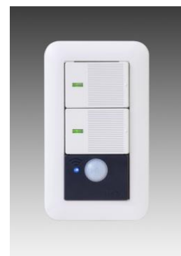
IoT スマートスイッチ 『Link-S 2 ®』

またスマートスピーカー側でシーンを組むことにより、エアコンや家電製品との連携操作も可能となります。