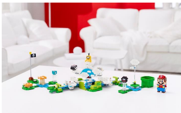
71389 ジュゲムの フワフワ チャレンジ