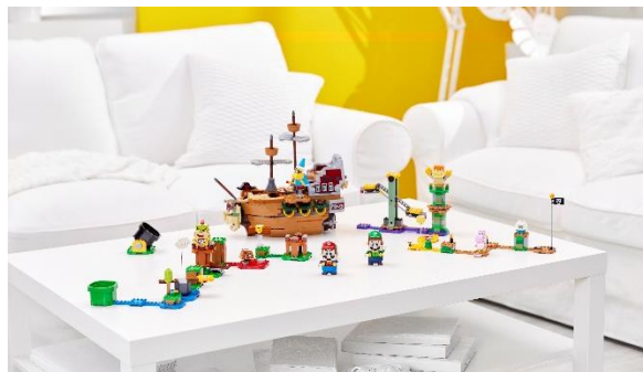
71391 のりこめ! クッパのひこうせんかん チャレンジ