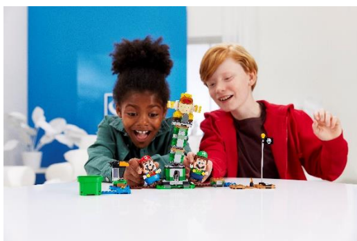
71388 ボスKKの グラグラタワー チャレンジ