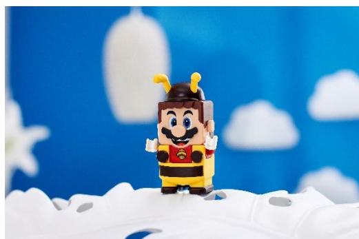
71393 ハチマリオ パワーアップ パック