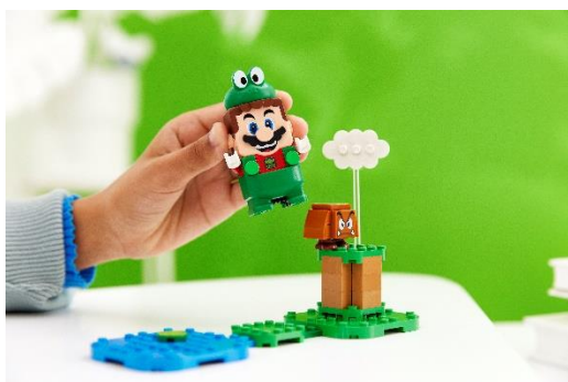
71392 カエルマリオ パワーアップ パック