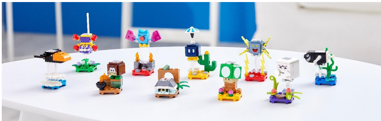
71394 キャラクター バック シリーズ3