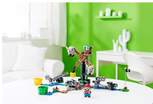
71390 めざせ てっぺん! ブイブイの リフト チャレンジ