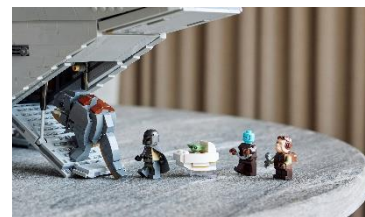
グローグー™、マンダロリアン™、ミスロル™、クイール™のミニフィギュアと組み立て式のブラーク™のモデルが付属