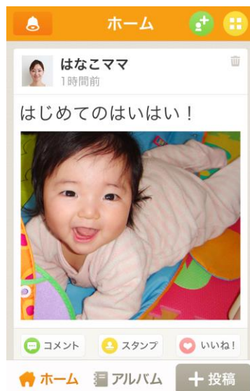
《wellnote Lite 版ホーム画面イメージ》

『wellnote (ウェルノート)』は、子育て世代の夫婦とその両親（シニア）世代に支持されている、日本で初めての家族専用の無料 SNS です。“家族だけ”の安心のセキュリティのもと、動画や写真、メッセージを共有し、こどもの成長、それを見守る家族の想いを「我が家の思い出日記」として記録することができます。この度のプリセットにより、3 世代を繋ぎ、幸せな家族コミュニケーションをより一層サポート、応援してまいります。