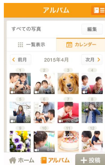
《wellnote Lite 版アルバム画面イメージ》