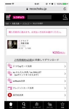
情報サイトへアクセス