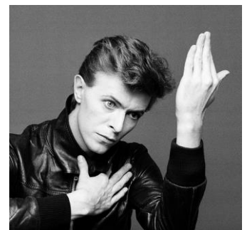
アルバム『ヒーローズ』に使われた写真

この他、京都でのプライベート・フォトセッションなど、鋤田正義だからこそ知るデヴィッド・ボウイの素顔が明かされます。