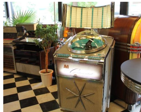
▲番組に出てくる Jukebox はこちら。※都内の「FLAT4 VINTAGE ジュークボックスショールーム」にて撮影。

今地球から一番離れたところにあるレコードは、ボイジャーの「ゴールデンレコード」。このレコードに、1曲だけロックンロールが収録されている！それがこの曲。1977年に打ち上げられた惑星探査機ボイジャー。「いつの日か、宇宙人に見つけられるだろう」ということで、ボイジャーには、地球の様々な音楽や音、挨拶などが収録されたレコードが搭載されている。今も、地球から186億キロ彼方を飛んでいます。果たして宇宙人にロックンロールは届いているのでしょうか…！