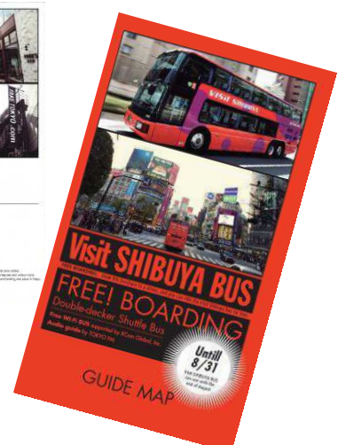
ガイドマップイメージ