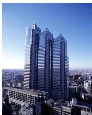
新宿パークタワー

東京ガス不動産は、「災害に強いまちづくりの推進」「一人ひとりに寄り添う魅力的な毎日の創出」「環境にやさしい不動産の実現」の 3 つのマテリアリティを通じ、東京ガスグループ 2023-2025 年度中期経営計画「Compass Transformation 23-25」で掲げた「安心・快適・環境との調和を提供する ESG 型不動産開発」を推進しています。その具体的な取り組みとして、保有する新宿パークタワーのビル共用部の使用電力を実質再生可能エネルギー化し、今後、テナント専用部への導入検討を進める等、お客さまと一緒にビル単位で脱炭素社会の実現に貢献していきます。