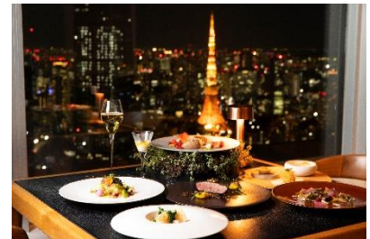
賞品ディナー イメージ