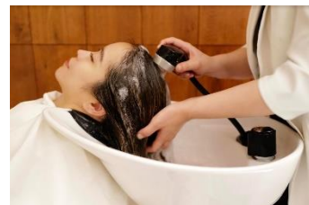
カキモト アームズ