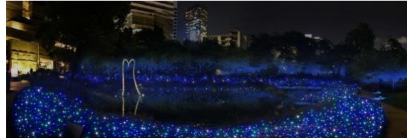
「毛利庭園イルミネーション」(イメージ)

開催期間： 11月18日(金)～12月25日(日) 時間： 17:00～23:00 場所： 毛利庭園 ライティングデザイン： 内原智史デザイン事務所 協賛： アバター:ウエイ・オブ・ウォーター