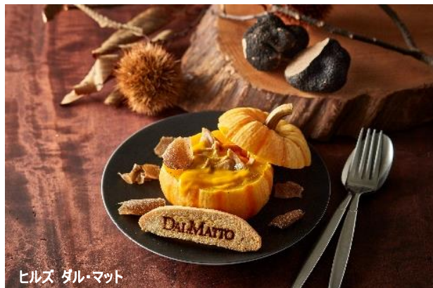
ヒルズ ダル・マット

実りの秋、六本木ヒルズの「秋の味覚メニュー」で、至福のひとときをご堪能ください。