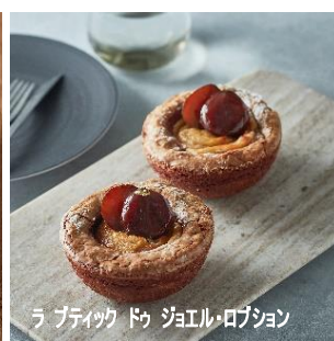
ラ プティック ドゥ ジョエル・ロブション