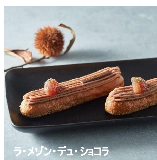
ラ・メゾン・デュ・ショコラ