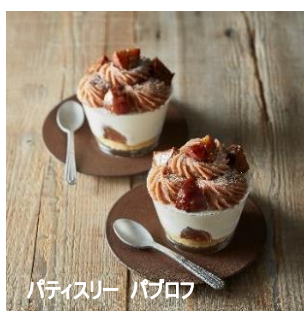
パティスリー パブロフ