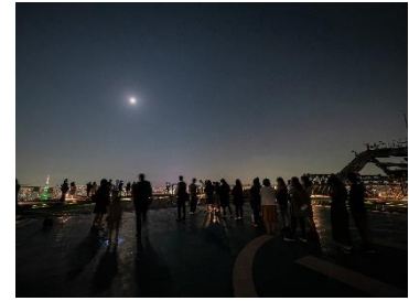
過去の観望会の様子

今年も毎月第 4 金曜日に、「星のソムリエによる天文ニュースと翌月の星空解説セミナー&星空観望会」を行います。当面の間、星空解説セミナーは感染症予防の観点から、Zoom ウェビナーによるオンライン開催となります。天文の専門家“星のソムリエ”である泉水朋寛氏が、初心者の方にも分かりやすく星空の解説をいたします。星空観望会は、六本木ヒルズ森タワー屋上スカイデッキでの開催となります。海拔 270m の関東随一の高さを誇る屋上展望台「スカイデッキ」から、東京に広がる星空と夜景をお楽しみください。