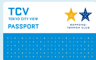
「東京シティビューパスポート」イメージ