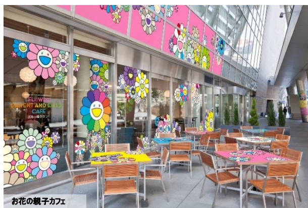
お花の親子カフェ

今回、オープンする「お花の親子カフェ」には、〈カイカイキキ〉の限定商品などを扱う「Tonari no Zingaro POP UP STORE」を併設。リアル店舗やWEBショップ以外で唯一、「Tonari no Zingaro」商品を手にとれるショップとなります。村上氏の「お花」をモチーフにしたマスクやクッションなどの人気商品に加え、クッキーやステッカーなど新作の《お花の親子》関連アイテムが集合。また、カフェスペースでは、「お花お子様ランチ」や「サーモン・いくらのお花の親子プレート」など「親子」にちなんだメニューも提供します。