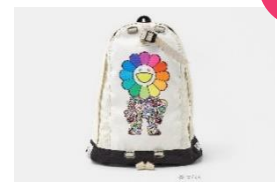
TMP X GREGORY デイバック 他 価格: 33,000 円 サイズ: 40x45.5x16.5cm

2F でカジュアル、3F でドレスアイテムを取り揃えるビームス最大級の店舗面積を誇る旗艦店。ハイファッション、ハイカジュアル、ハイクオリティをキーワードに、BEAMS が考える“ハイスティール”を表現します。