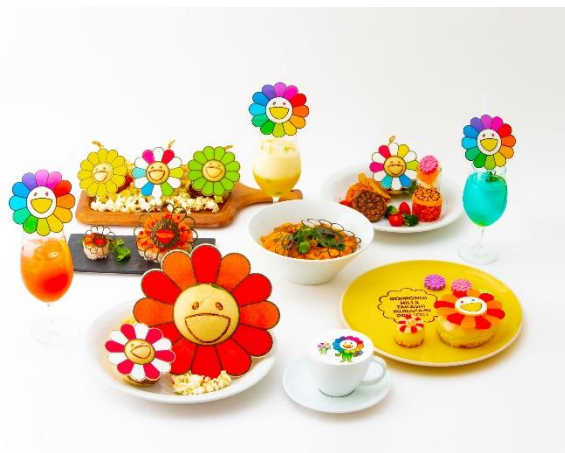
「お花の親子カフェ」メニュー

この春は、六本木ヒルズで村上氏の《お花の親子》の世界観を存分にお楽しみください。