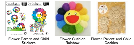
Flower Parent and Child Stickers