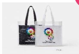
4way エコバッグ 他 価格: 3,960 円 サイズ: 約 35x37x10cm

ニューヨークやパリのセレクトショップをイメージした店内には、東京発のコレクションブランドとストリートカジュアルを融合したハイストリートモード系のアイテムのほか、オリジナルブランドもラインナップ。アクセサリーや小物なども豊富に取り揃えております。