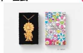
ペンダント 参考価格: 165,000 円

(ウエストウオーク 4F) 歴史に裏付けされた伝統の技術を生産背景に、時代を越え受け継がれる銘品作りを志し、2007 年に日本一の宝飾産地山梨県甲府市にて上島徹也が立ち上げたジュエリーブランド。身に着けた人のライフスタイルと共に長年受け継がれる作品を創造しています。