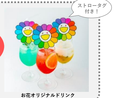
お花オリジナルドリンク