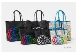
トートバッグ PM/トートバッグ MM 価格: 22,000 円/30,800 円 サイズ: PM 20x20(下)x30(上)x12cm MM 26x26(下)x39(上)x15cm

国内外の新たなブランドを紹介してきた B'2nd が、六本木エディションとして junhashimoto、TATRAS を中心に素材や機能美にこだわった大人デイリーウェアとスニーカーコレクションをセレクト。