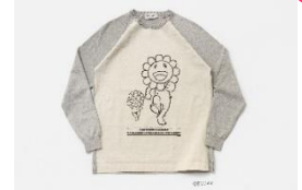
コットンニット 価格: 38,500 円 サイズ: M/L

フロアはメンズとレディス、それぞれがデイリーなラインとドレスラインに分かれ、小部屋のように落ち着けるスペースです。自身のために、大切な誰かのために、この地を訪れたトラベラーのために、大人の男女がショッピングの楽しみを共有できる空間です。