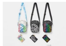
クロスボディバッグ/ マルチカードケース 価格: 28,600 円/19,800 円 サイズ: 21x14x4.5cm 8x13cm