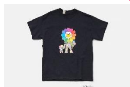
T シャツ 価格: 15,400 円 サイズ: 36/38/40(メンズ)

(ウエストウオーク 4F) ヴィンテージショップでキャリアをスタートした尾花大輔により、2001 年設立。過去にあったこと、もしくは、今ある古いものに新しい価値観を加え、全く新しいものを表現するブランド。六本木ヒルズ店限定のサービスと、他店舗とは一味違う商品を取り揃えています。