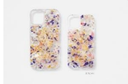
FLOWER iPhone ケース 他 価格: 8,800 円 サイズ: iPhone 12/iPhone 12 mini

国内外の新たなブランドを紹介してきた B'2nd が、六本木エディションとして junhashimoto、TATRAS を中心に素材や機能美にこだわった大人デイリーウェアとスニーカーコレクションをセレクト。