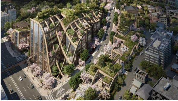
ヘザウィック・スタジオによる 特徴的なデザインの低層部(イメージ)

「虎ノ門・麻布台プロジェクト」は、「アークヒルズ」に隣接し、「文化都心・六本木ヒルズ」と、「グローバルビジネスセンター・虎ノ門ヒルズ」の中間にあり、文化とビジネスの両方の個性を備えたエリアに立地しています。約8.1haもの広大な計画区域は圧倒的な緑に包まれ、約6,000㎡の中央広場を含む緑化面積は約2.4haに上ります。延床面積約861,500㎡、オフィス総貸室面積213,900㎡、住宅戸数約1,400戸、A街区タワーの高さは約330m、就業者数約20,000人、居住者数約3,500人、想定年間来街者数2,500～3,000万人で、そのスケールとインパクトは六本木ヒルズに匹敵します。本プロジェクトは、当社がこれまでの「ヒルズ」で培ったすべてを注ぎ込んだ「ヒルズの未来形」として誕生します。