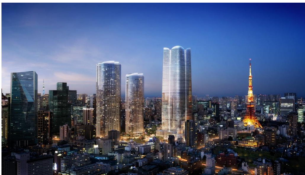
虎ノ門・麻布台プロジェクト

森ビル株式会社(東京都港区、代表取締役社長:辻慎吾)は、2023年の開業に向けて推進中の大規模都市再生事業「虎ノ門・麻布台地区第一種市街地再開発事業(以下「虎ノ門・麻布台プロジェクト」)」において、世界有数のスモールラグジュアリーリゾートとホテルを擁する「アマン」とのパートナーシップにより、ブランデッドレジデンス「アマンレジデンス 東京」と、アマンの姉妹ブランドとなる日本初進出のラグジュアリーホテル「ジャヌ東京」を開業します。