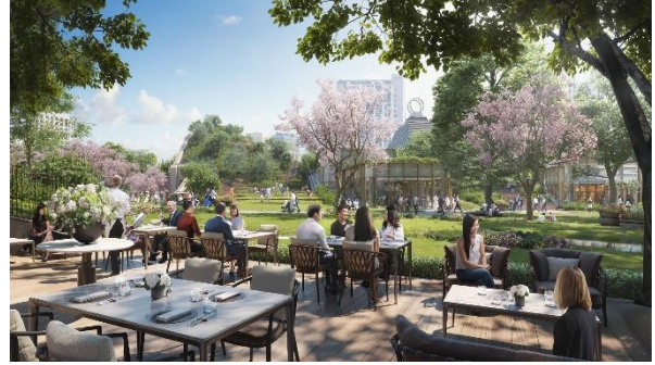
中央広場をのぞむホテルレストラン(イメージ)