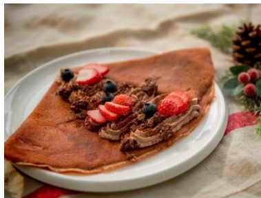
ブッシュ・ド・ノエルクレープ 1,100 円