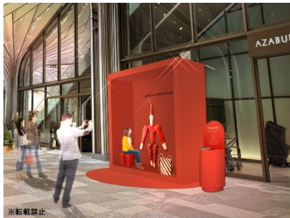
PRESENT BOX@麻布台ヒルズ マーケット前 大きなプレゼント BOX に入れるフォトスポット。中のサンタには楽しい仕掛けも。