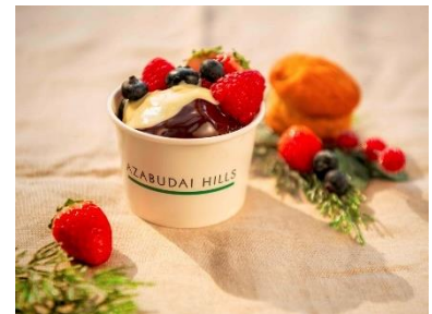
チョコフォンデュ・カップケーキ 700 円