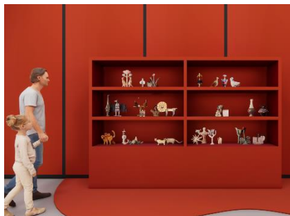
SHELF@麻布台ヒルズ マーケットエリア キービジュアルで使用された作品の実物が並んだ棚と一緒に撮影できるスポットです。