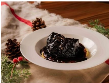
牛ホホ肉の赤ワイン煮込み 2,800 円

中央広場内の「麻布台ヒルズ キオスク」では、クリスマスの定番ブッシュ・ド・ノエルをイメージし「ブッシュ・ド・ノエルクレープ」や、フルーツとチョコレートの相性抜群な「チョコフォンデュ・カップケーキ」を展開。中央広場に面する「麻布台ヒルズカフェ」でも国産牛を使用した「牛ホホ肉の赤ワイン煮込み」などクリスマス限定メニューを販売します。