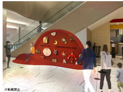
HILLS@タワープラザ1F キービジュアルを背景に写真を撮れる丘をイメージしたフォトスポット