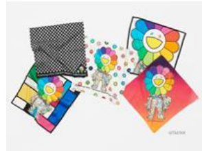
クラシス・ザ・スモールラグジュアリー