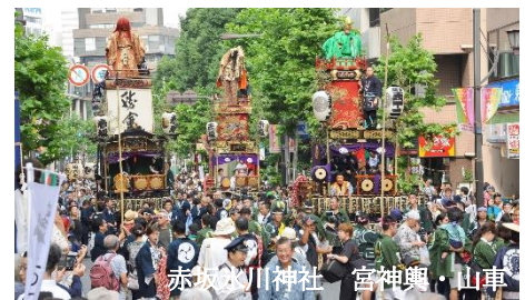
赤坂氷川神社 宮神輿・山車