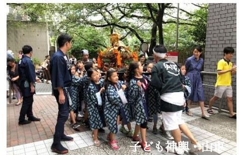
子ども神輿・山車