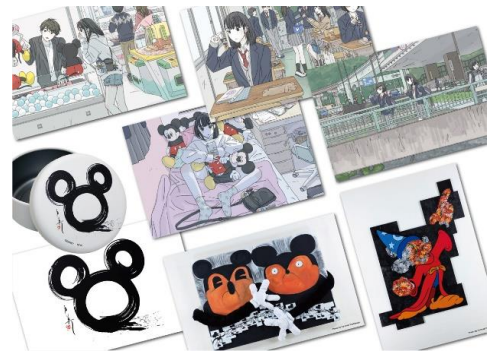
日本人アーティストグッズ(一部): 日本展オリジナル企画・日本人アーティストによる作品のグッズも