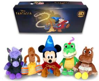
・左: ファンタジア/モデルシート/ぬいぐるみ 8,800 円(税込) ・右: ピーンズコレクション/ファンタジア/80 周年限定セット 12,100 円(税込) ※会期スタート時は、店頭での受注販売(お一人様 1 個まで) 後日配送となりますので、予めご了承ください。