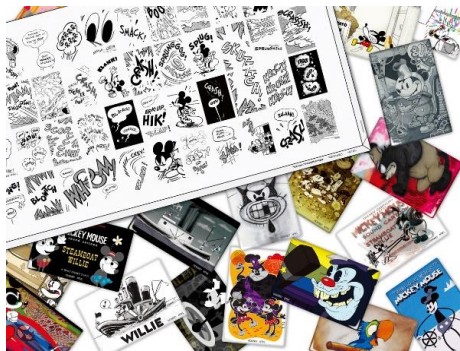
ニューヨーク展 (MTO) アーティストグッズ(一部): ニューヨーク展から来日する作品の色鮮やかなグッズ