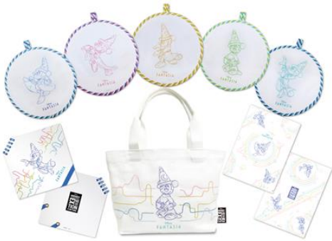
『ファンタジア』スケッチグッズ(一部): 『ファンタジア』の豊かな音楽を五線譜でイメージしたスケッチで表現

なお、オリジナル商品の一部は、10 月 30 日(金)よりオープンするディズニー公式オンラインストア「shopDisney(ショップディズニー)」*内ミッキー Maus 展特集ページ( http://shopDisney.jp/top2020/ )でも購入可能です。*利用は日本国内限定 ※アイテムの詳細につきましてはミッキー Maus 展の別途プレスリリース( https://prtimes.jp/main/html/rd/p/000000004.000065860.html )をご確認ください。