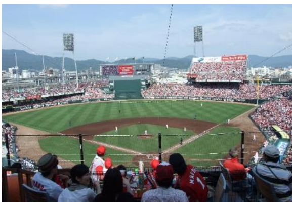
MAZDA Zoom-Zoom スタジアム広島