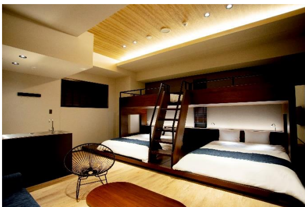
『FAV HOTEL TAKAMATSU』 客室