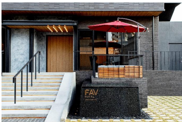
『FAV HOTEL TAKAMATSU』 外観

霞ヶ関キャピタル株式会社（本社：東京都千代田区、代表取締役：河本幸士郎、以下「当社」といいます。）はこの度、当社がホテル事業（開発・運用・売却等）に係るアセットマネジメント業務を受託している香川県高松市におけるホテル開発プロジェクトについて、『FAV HOTEL TAKAMATSU』（香川県高松市）を2020年11月20日に開業することをお知らせいたします。