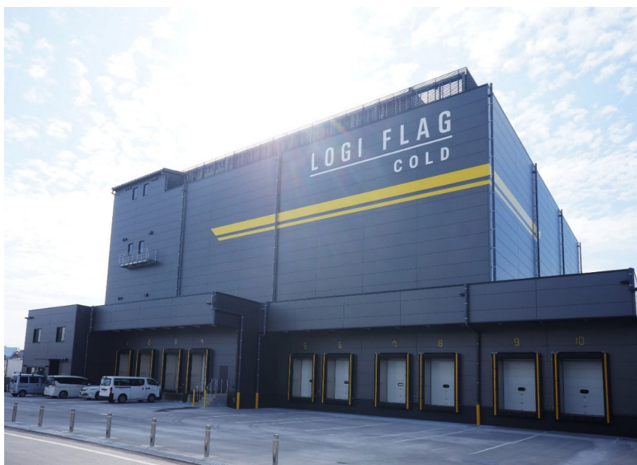
（『LOGI FLAG COLD 船橋 I』外観）